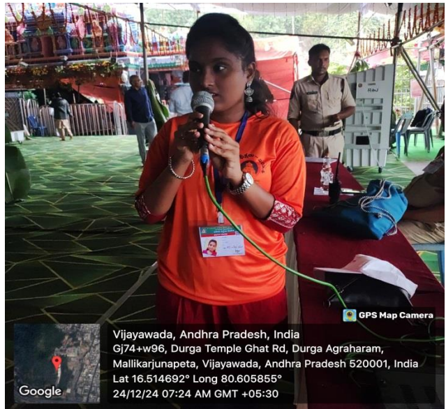
Vijayawada, Andhra Pradesh, India GJ74+w96, Durga Temple Ghat Rd, Durga Agraharam, Mallikarjunapeta, Vijayawada, Andhra Pradesh 520001, India Lat 16.514692° Long 80.605855° 24/12/24 07:24 AM GMT +05:30