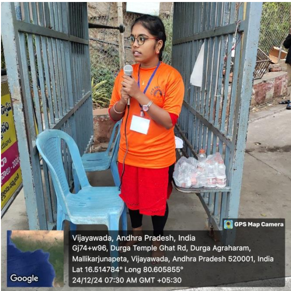
Vijayawada, Andhra Pradesh, India GJ74+w96, Durga Temple Ghat Rd, Durga Agraharam, Mallikarjunapeta, Vijayawada, Andhra Pradesh 520001, India Lat 16.514784° Long 80.605855° 24/12/24 07:30 AM GMT +05:30