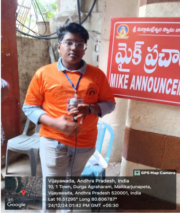
Vijayawada, Andhra Pradesh, India 10, 1 Town, Durga Agraharam, Mallikarjunapeta, Vijayawada, Andhra Pradesh 520001, India Lat 16.51295° Long 80.606787° 24/12/24 01:42 PM GMT +05:30