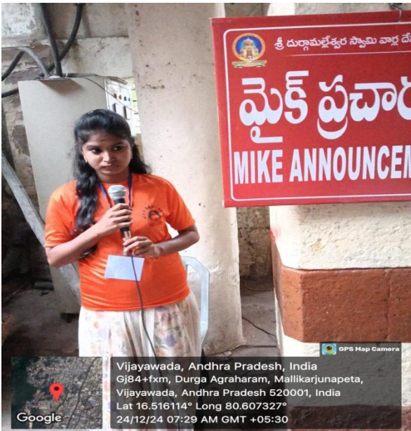
Vijayawada, Andhra Pradesh, India GJ84+fxm, Durga Agraharam, Mallikarjunapeta, Vijayawada, Andhra Pradesh 520001, India Lat 16.516114° Long 80.607327° 24/12/24 07:29 AM GMT +05:30